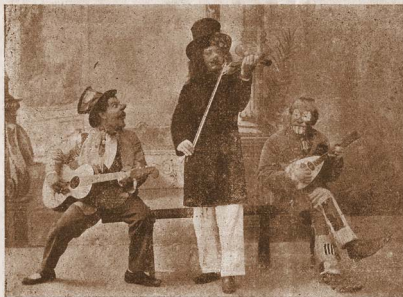
Original Decarussio trio